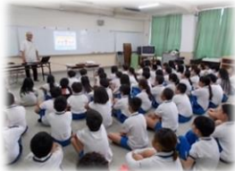
広報啓発活動 (非行防止教室)