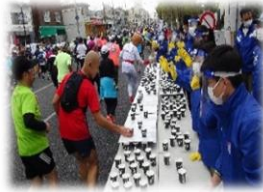
立ち直り 支援活動