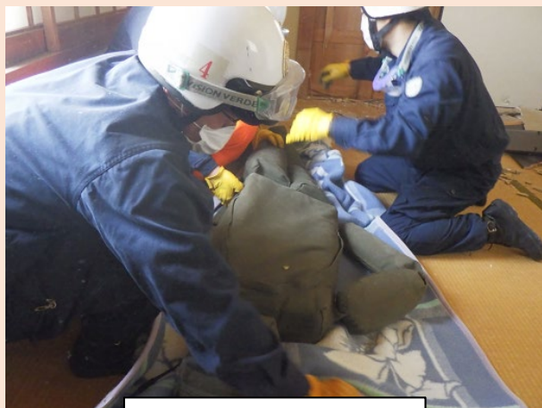
要救助者の容態観察