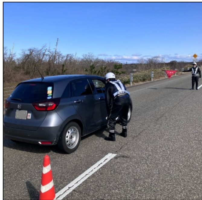
【物資搬送車等以外の車両を停止させて、通行目的の確認等を実施】