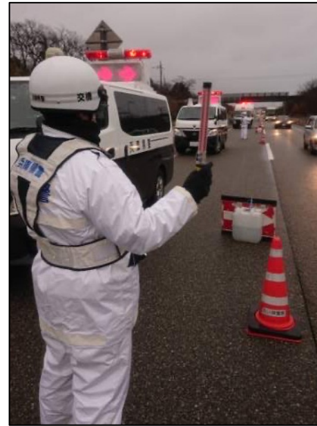
【降雨の中、通行車両の選別検問を実施】