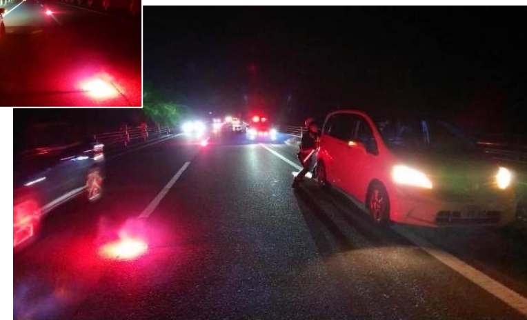
【本線道路上からの故障車両の排除を実施】