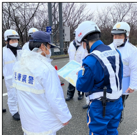
【先に配置していた大阪府警から引継ぎを受ける】