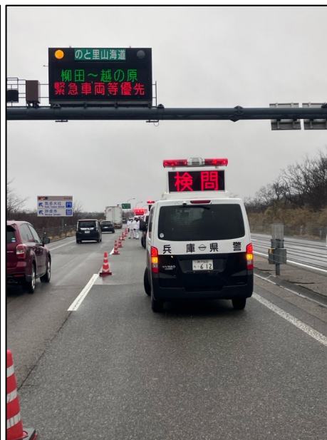
【サインカーや標識車の活用】