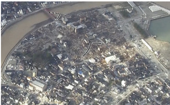
輪島市朝市の火災現場