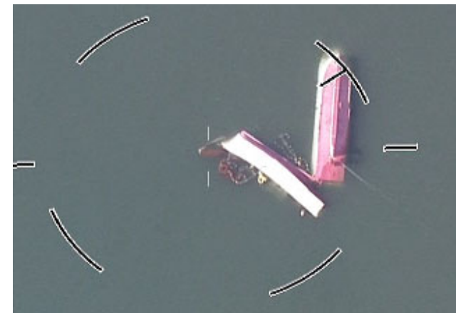
志賀町における漁船転覆状況