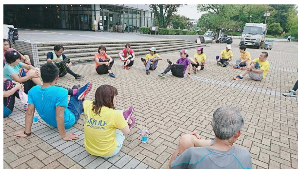
ストレッチの実技講習