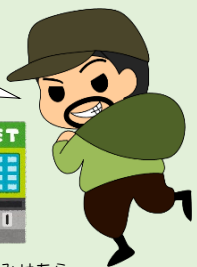
てみせあら出店荒したろう