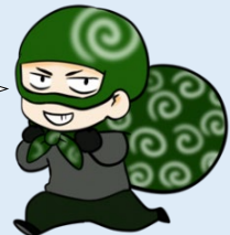
しのびに忍込むぞう