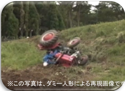
※この写真は、ダミー人形による再現画像です。