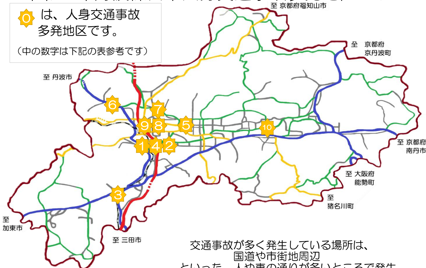
人身交通事故多発地区