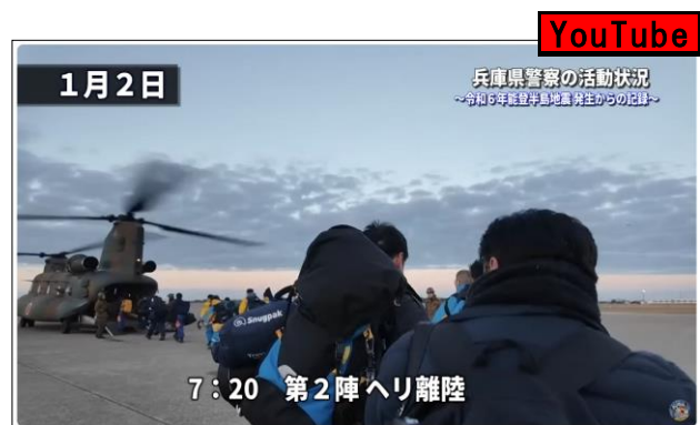
【ユーチューブ「兵庫県警察公式チャンネル」】