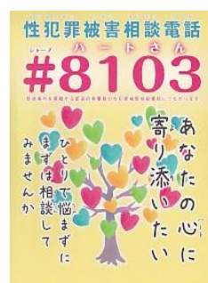
【#8103（ハートさん）ポスター】

また、殺人、傷害、性犯罪を始めとする身体的な犯罪や、死亡事故を始めとする一定の交通事故の被害者等に対して、刑事手続の流れや犯罪被害給付制度の概要、相談窓口などの情報を盛り込んだ「被害者の手引」を交付するとともに、臨床心理士等の資格を有する被害者支援カウンセラーや委嘱相談員によるカウンセリングを行うほか、相談窓口や各種支援制度を教示するなど、きめ細かな支援を推進している。