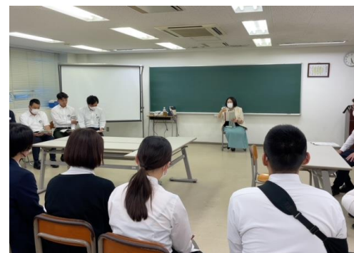
【 医師による講義 】