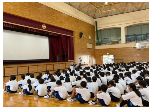
【命の大切さを学ぶ授業】

「社会全体で被害者を支え、被害者も加害者も出さない街づくり」に向けた気運の醸成を図るため、中学生、高校生等を対象とした被害者遺族等の講演による「命の大切さを学ぶ授業」を開催しているほか、犯罪被害者週間等における街頭キャンペーンや、兵庫県警察ホームページ、SNSの活用等、様々な広報媒体を通じた広報啓発活動の充実に努めている。