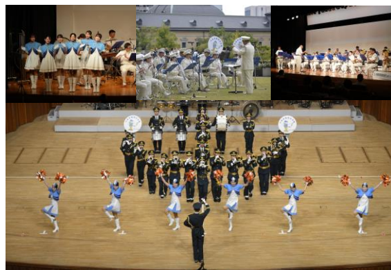
【警察音楽隊の活動】

警察音楽隊は、県民と警察を結ぶ「音のかけ橋」として、県内各地で行われる防犯キャンペーンや交通安全運動などにおいて、演奏活動を通じた広報を実施しているほか、金曜コンサート、定期演奏会などの自主演奏会を開催して、県民と警察との融和を図っている。