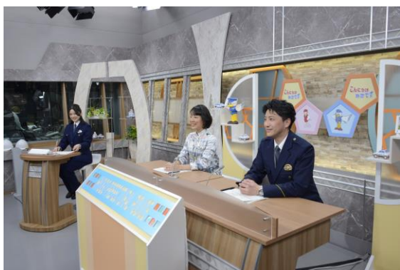
【テレビ広報番組「こんにちは県警です」】

また、県下15警察署では、地元ケーブルテレビ局を活用し、地域住民に対して、防犯や交通事故防止などの身近な情報を発信している。