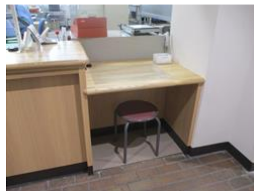
【警察署窓口（宍粟警察署）】