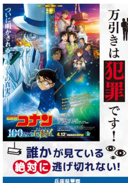
【タイアップポスター】