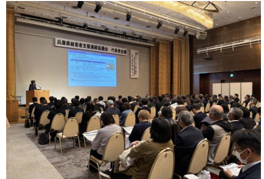
【兵庫県被害者支援連絡協議会】

県や市のほか、医師会や弁護士会等被害者支援に係る関係機関・団体が相互に協力し緊密な連携を図るため、ネットワークを構築し、それぞれの専門分野についての情報交換や被害者支援に関する広報啓発活動などを行っている。