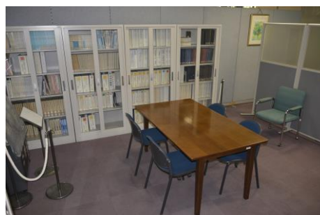
【文書閲覧コーナー】

「県民情報センター」では、県民に情報を広く提供するため「文書閲覧コーナー」を設置し、犯罪統計書、交通年鑑、警察白書などの文書を備え付け、公開している。