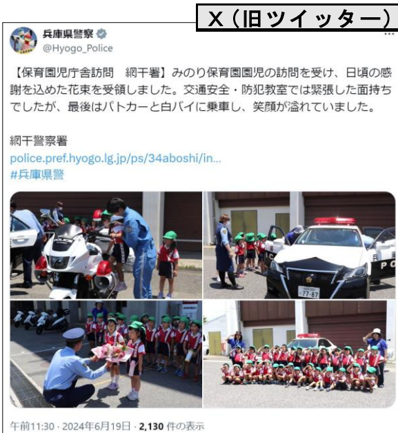
【兵庫県警察 X（旧ツイッター）】