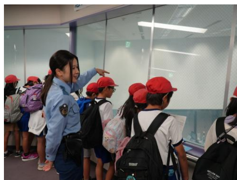
【警察本部の庁舎見学の状況】