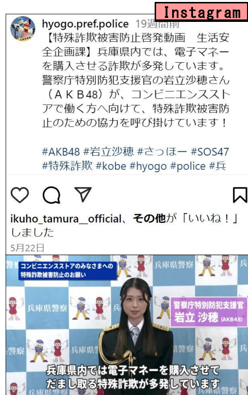
【兵庫県警察インスタグラム】