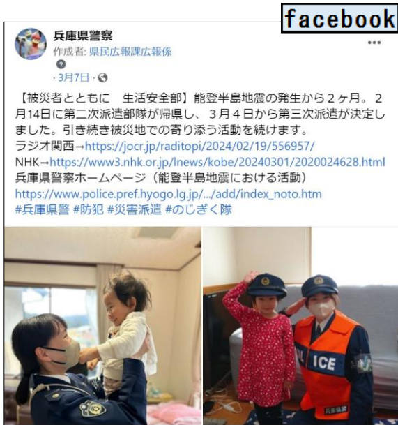
【兵庫県警察フェイスブック】

より幅広い世代への情報提供を目的として、ソーシャルネットワーキングサービスの「フェイスブック」、「インスタグラム」、「X（旧ツイッター）」、動画共有サービスの「ユーチューブ」を活用し、各種キャンペーンや重要事件に関する情報、事故防止に関する情報、県警のPR動画など、速報性や拡散性といった特性を生かした情報発信に努めている。