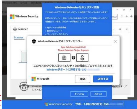
パソコンでの偽警告画面イメージ (これ以外にも複数の偽警告画面が確認されています)