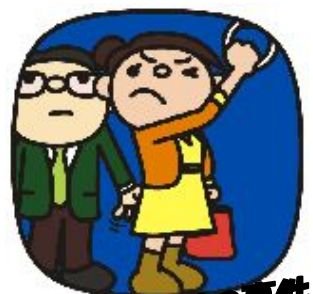
チカン・わいせつ事件