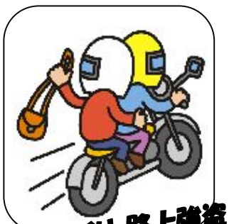
ひったくり・路上強盗