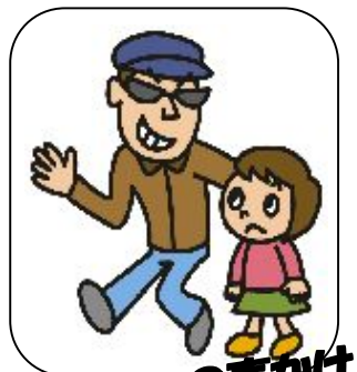
子どもへの声かけ

ご希望にそって、情報の種別や地域を選択することができます。また、発生場所付近の地図情報がご覧いただけます。