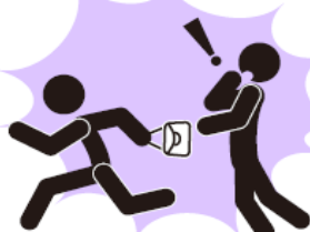
ひったくり・路上強盗