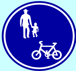
普通自転車歩道通行可の標識