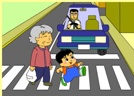
横断歩行者優先で事故防止!