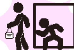
チカン・わいせつ事件