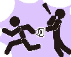
ひったくり・路上強盗